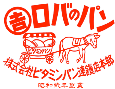
ロバのパン は登録商標です

* お二人は京都の本部 株式会社ビタミンパン連鎖店本部の 取締役も兼任されております。