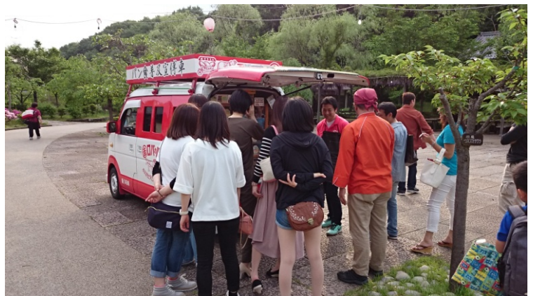
写真:今のロバのパン販売風景