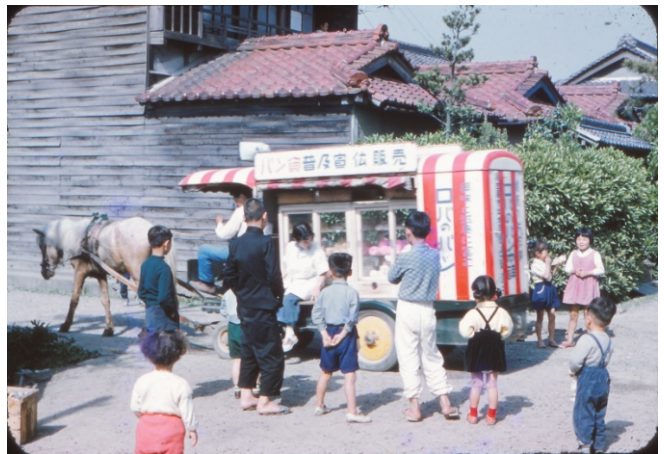
写真:昭和30年代の様子