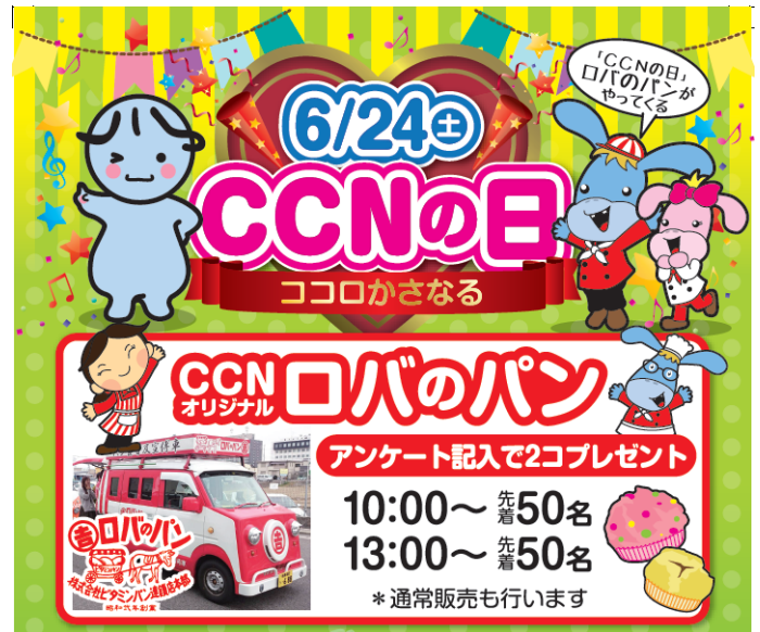
(写真:連携第一弾となるCCNの日のチラシ)